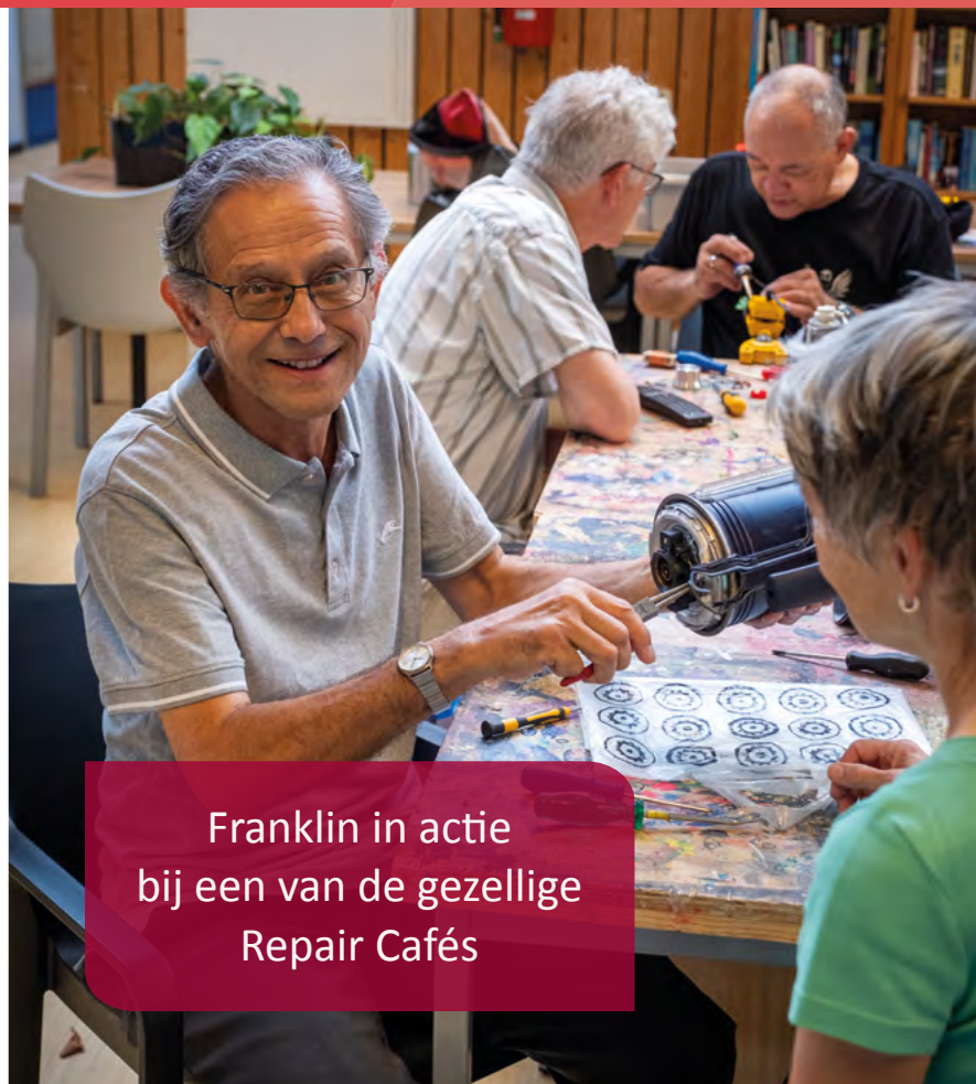
Franklin in actie bij een van de gezellige Repair Cafés

Het Repair Café in Wijkcentrum Kersenboogerd is elke tweede woensdag van de maand van 9.30 tot 11.30 uur.