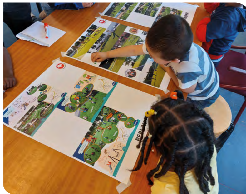
Kidsclub stemt over speeltoestellen Patio, Pergola en Prieel