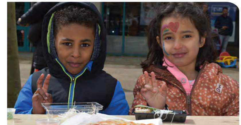
Buurtfestival april 2024

Bekijk de online vacaturebank via www.vrijwilligerspunt.com